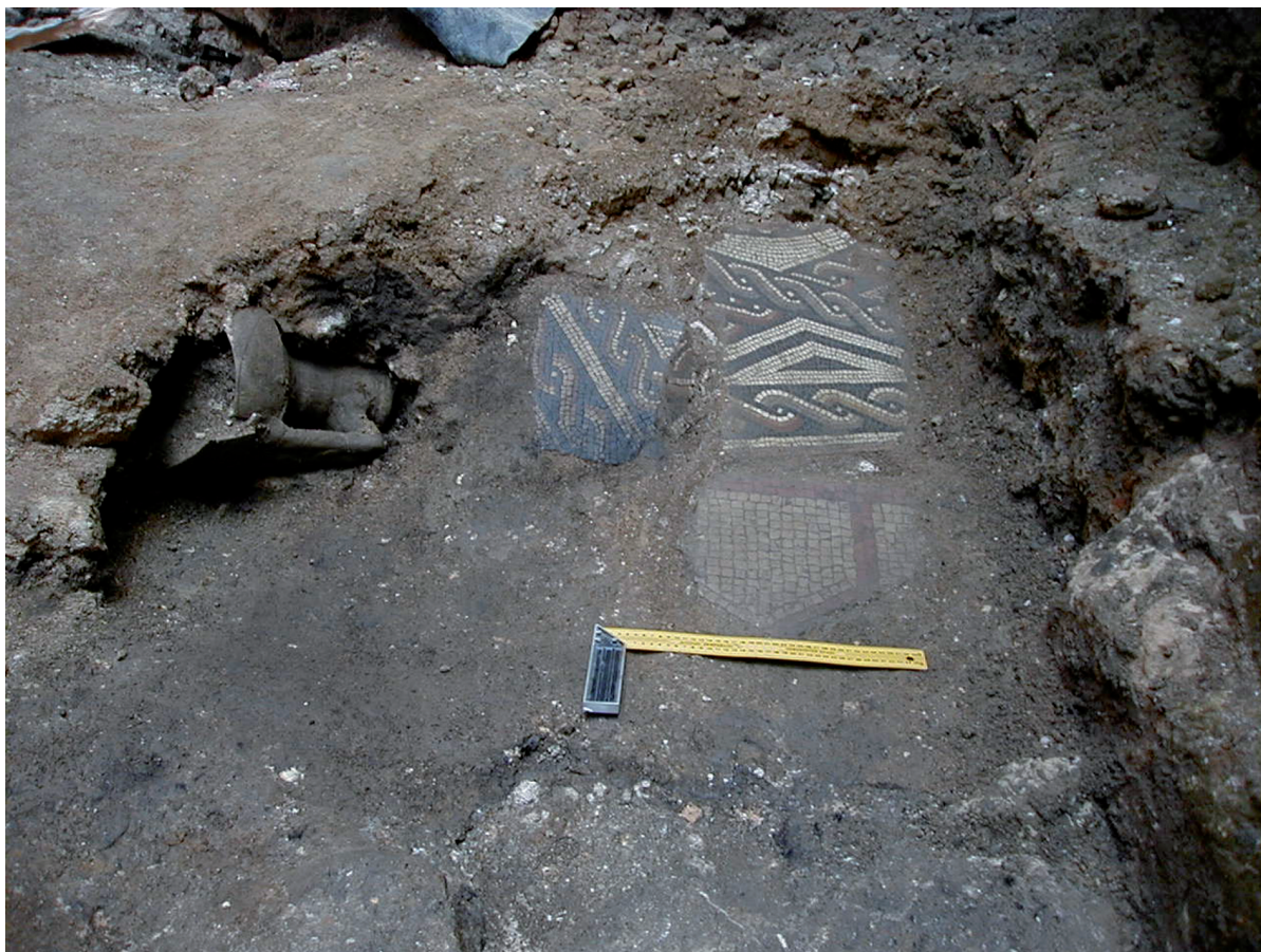
Foto 2. Contexto arqueológico

diversas unidades estratigráficas que no se describirán en esta publicación a excepción de la UE 11, donde se localizó el elemento arqueológico analizado.