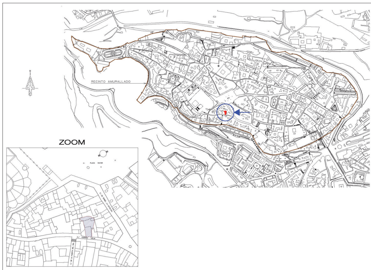
FOTO 1. Plano de situación

ha dado como resultado la documentación, cada vez más frecuente, de estratigrafías donde el horizonte romano tiene un peso importante, asociadas o no a estructuras de esa época.