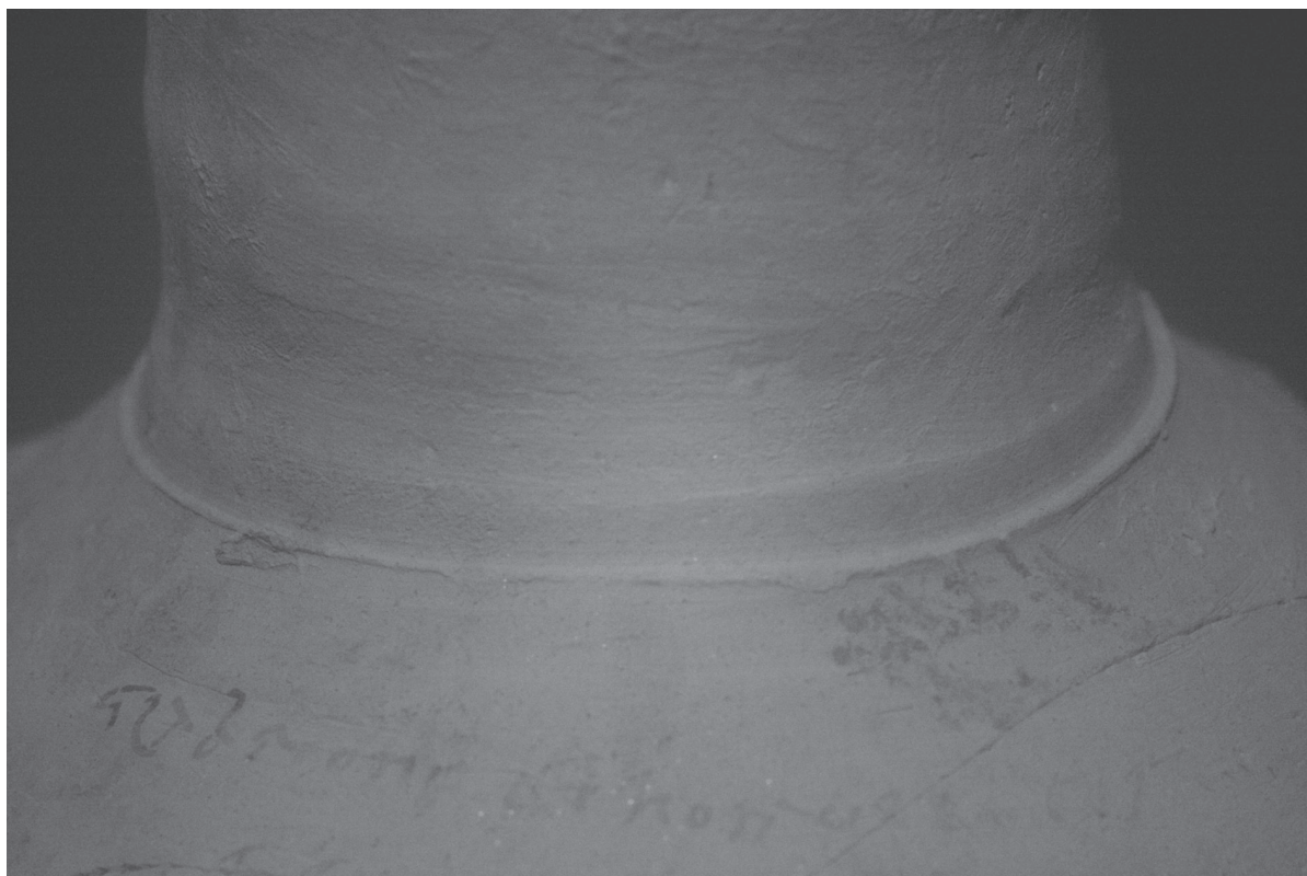
FOTO 4. Foto en infrarrojo

En la zona superior derecha de la panza, por encima del titulus , se hallan lo que nos ha parecido dos líneas de texto (cuyos caracteres no son identificables), realizado con un cálamo de punta fina.