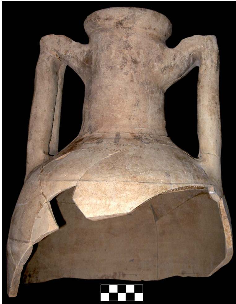
Foto 3. Ánfora Dressel 2-4